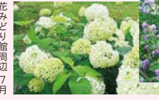
花みどり館周辺 7月