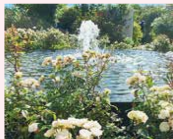
ローズガーデン 10月