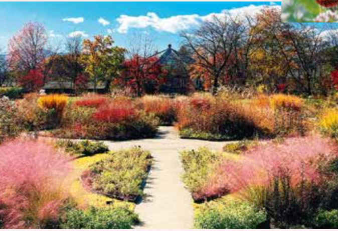
ナチュラルガーデン 11月

寒暖差により綺麗に色づく秋のバラ、秋風に揺れるグラスの穂の姿に目を奪われます。紅葉や落ち葉に差し込む光も美しく、様々な発見に満ちた季節。来季へ向けた剪定など、ガーデナーの丁寧な仕事も際立ちます。