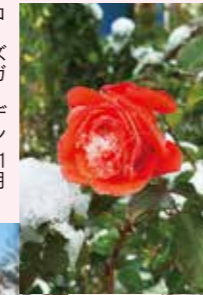
ローズガーデン 11月