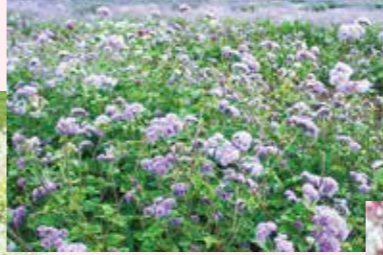
スパイラルフィールド 8月