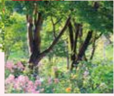
ふるさとの野山 8月