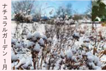
ナチュラルガーデン 1月