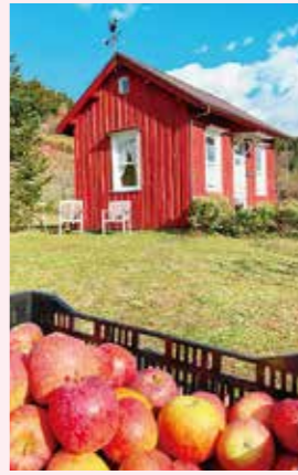
中之条ファーム 11月