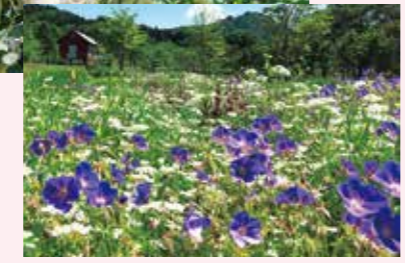
ナチュラルガーデン 5月