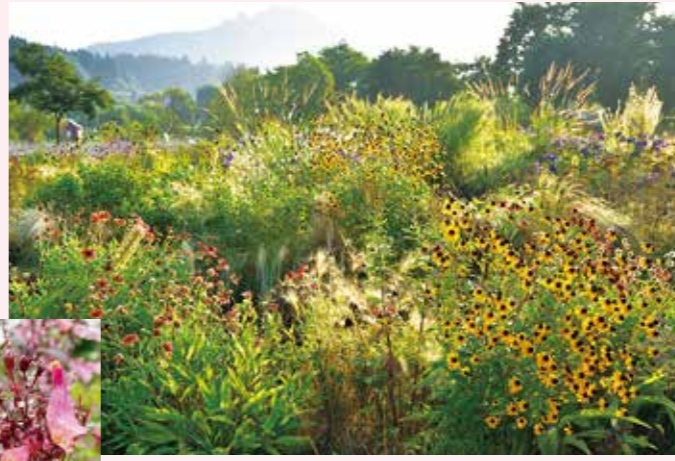
スパイラルガーデン 8月