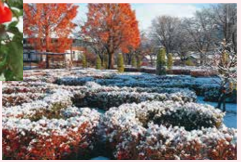
ノットガーデン 12月