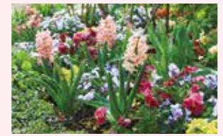
ローズガーデン 4月