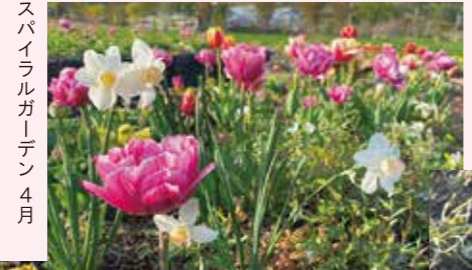
スパイラルガーデン 4月