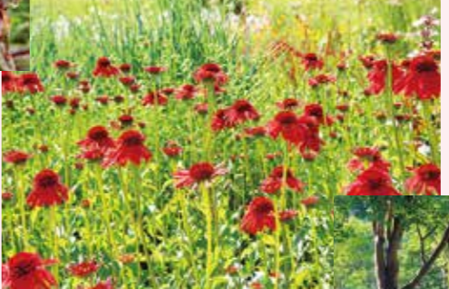
ナチュラルガーデン 8月