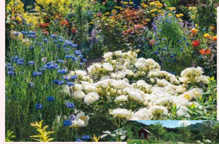
ローズガーデン 6月