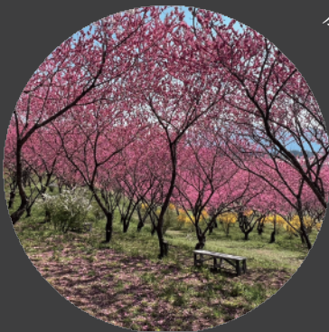
丘の中のベンチでくつろいで