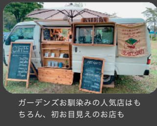
ガーデンズお馴染みの人気店はもちろん、初お目見えのお店も