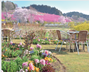
ローズカフェから眺める花桃の丘はおすすめ。ちょうどヒヤシンスが咲く時期です。